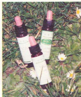
Základem Bachových esencí jsou květy stromů, křovin, ale i plevele.

Pokud by jste se u něj objednali na „vyšetření“, čekala by vás nejdříve konzultace s cílem najít příčinu vašich potíží. Ta je podle systému Bachovy květové terapie nejčastěji způsobena energetickým blokem v jemných strukturách organismu a velmi často souvisí s duševní disharmonií v osobním životě. Podle