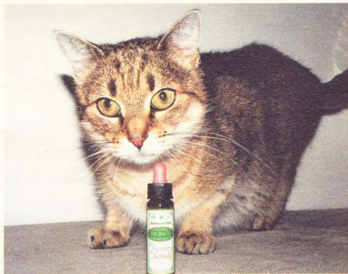
I když jsou kočky často typ pro aplikaci žehratky bahenní, doporučuje se při nervozitě kejklířka skvrnitá.

Edward Bach se narodil roku 1886 v Anglii a již na škole se rozhodl, že se stane léčitелеm. Po studiu medicíny pracoval jako bakteriolog. Během té doby objevil úzký vztah mezi chronickou nemocí a střešní flórou. Tento objev ho nasměroval k vyvinutí vakcín známých jako „Sedm Bachových nozod“, jež někteří homeopaté používají k pročištění zažívacího traktu dodnes. Ve třicátých letech se vzdal své slibné se rozvíjející lékařské kariéry a odstěhoval se na venkov, kde sbíral květy pro přípravu svých esencí. Těsně předtím, než v roce 1936 zemřel, označil svou práci za uzavřenou a svěřil ji spolupracovníkům se žádostí, aby zůstala nezměněná.